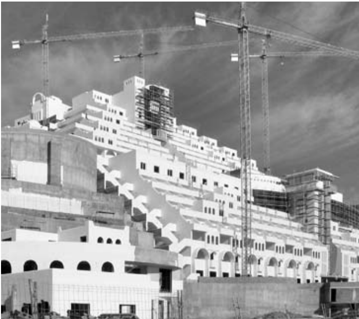
Hotel de El Algarrobico

Firma y distribuye la campaña a tus contactos